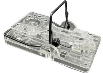
Tapette à rat transparente

Le piège Gorilla Traps est une tapette en plastique très résistant. La tapette dispose de 3 niveaux de sensibilité (faible, moyen, fort) afin de régler la tapette selon la grosseur des rongeurs à piéger et de vous éviter des déclenchements inutiles.