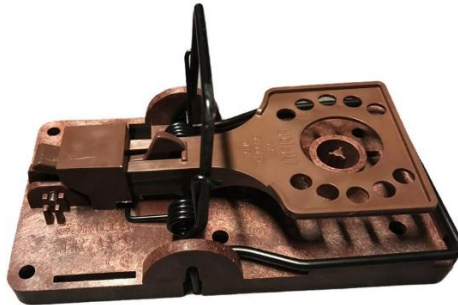
Tapette à rat