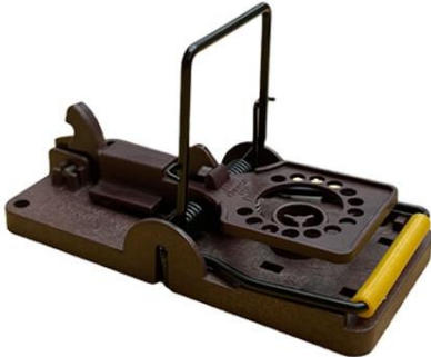
Tapette à souris